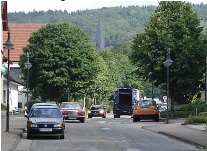
Alte Dorfstraße – So viel ist allerdings nicht immer los!

Bereits im Februar hatte der Ausschuss für Gemeindeentwicklung und Umwelt (GuU) mit den Stimmen von WiR, CDU und FDP beschlossen, die Alte Dorfstraße mit einer Asphaltdecke in 4,50 m Breite zuzüglich beidseitiger Rinnen von je 0,5 m umzugestalten. Die Firma Röper wurde beauftragt, auf dieser Basis den 1. Bauabschnitt vom Dorfbrunnen/Buersche Straße bis Zum Nonnenstein zu planen. In der April-Sitzung wurden zwar die Muster für die Probepflasterungen von Bürgersteig und Rinne ausgesucht, die Planung des 1. Bauabschnitts lag jedoch nicht vor. WiR, CDU und FDP sorgten mit ihrem gemeinsamen Antrag dafür, dass in der Juni-Sitzung die Vorlage der genannten Planung und die Beschlussfassung auf die Tagesordnung kamen – die Verwaltung hatte es so nicht vorgesehen.